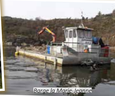
Barge la Marie-Jeanne