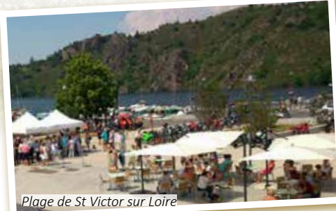
Plage de St Victor sur Loire