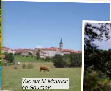
Vue sur St Maurice en Gourgois

Enlèvement des embâcles et corps flottants pouvant être prélevés mécaniquement, dans le cadre du conventionnement avec Electricité de France, concessionnaire du plan d'eau auprès de l'Etat