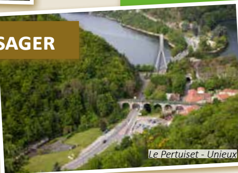
Le Pertuiset - Unieux

Acquisitions / cessions foncières et immobilières justifiées d'un point de vue patrimonial