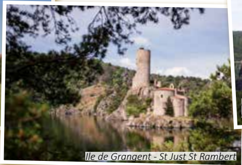
Ile de Grangent - St Just St Rambert