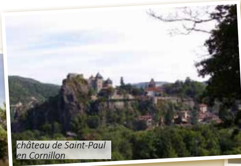
château de Saint-Paul en Cornillon