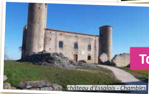
château d'Essalois - Chambles